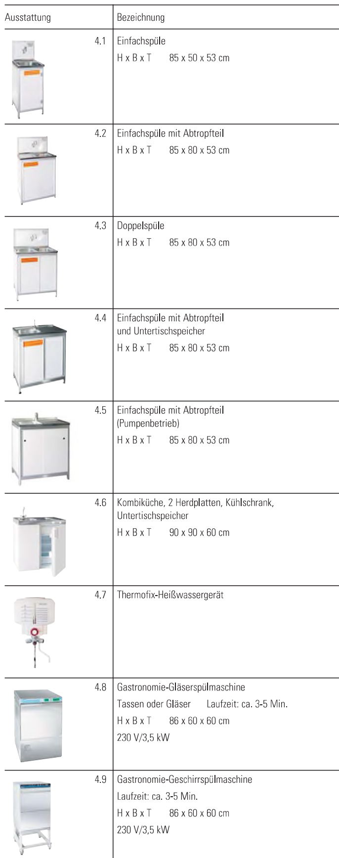
Illustration der Mietgeräte